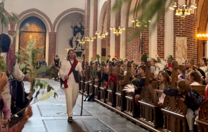
På Sporet af Jesus 2024

Så vi kan med en vis lettelse konstatere, at i Roskilde Domprovsti er meget ved det gamle. Vi har fine rammer for at kirken kan byde ind i menneskers liv med forskellige aktiviteter og opbyggelig forkyndelse, og de rammer har vi fortsat, for nu er der faktisk valgt 12 nye menighedsråd, som den 1. søndag i advent tager hul på en ny periode med arbejde og opgaver til fællesskabets bedste.